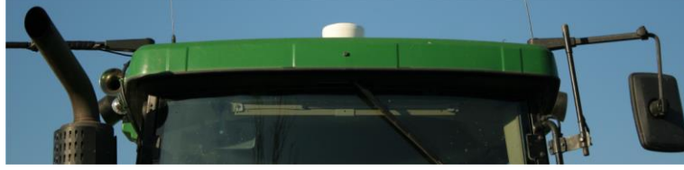
Bir traktörün çatısı üzerindeki GPS Alıcısı